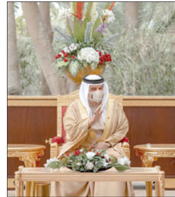
منوهاً بنجاحات أبناء البحرين في مختلف المجالات لرفع راية الوطن خفاقة