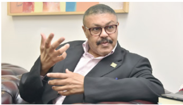
مدير مركز الأميرة الجوهرة البراهيم للطب الجزيئي

* ما أبرز الخطط الاستراتيجية والدراسات والأبحاث المرتبطة المقرر مناقشتها هذا العام في المركز؟ - الخطط الاستراتيجية متعلقة بمجال عمل المركز في التشخيص حيث سنطور هذا القسم بإضافات جيدة لأجهزة الجيل القادم من تحليل الجينوم البشري واستيعاب استشاري هذا النوع من التحليل والأجهزة ليستخدم في مختبرات الجينات بالمركز. في ما يتعلق بالأبحاث والبرامج الأكاديمية سيتم افتتاح مركز الطب التجديدي في مجال البحث والعلاج بالخلايا الجذعية ومعالجة الشيخوخة. كما تستمر أبحاث المركز في تخصصاته المختلفة وفي تطوير برامج في الطب الجزيئي والطب الشخصي وطب النانو والمناعة الجزيئية في كل ما يتعلق بالأمراض السائدة في منطقة الخليج العربي. أيضاً سيقوم المركز بفعاليات عبر الويب احتفاءً باليوم العالمي للأمراض النادرة في نهاية الشهر الجاري كما جرت العادة في كل عام.